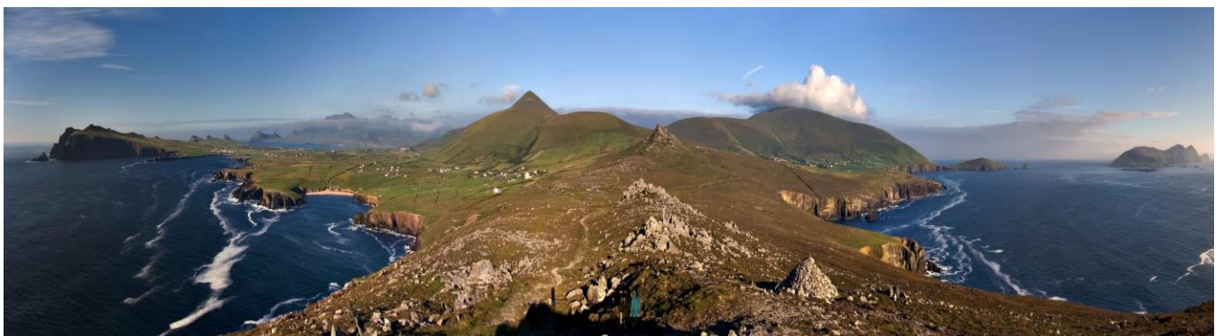
Dingle peninsula panorama crop.jpg

eine Spektakuläre Aufnahme der Dingle-Halbinsel, welche ich auf der Seite von Wikipedia gefunden habe. http://de.wikipedia.org/wiki/Dingle-Halbinsel