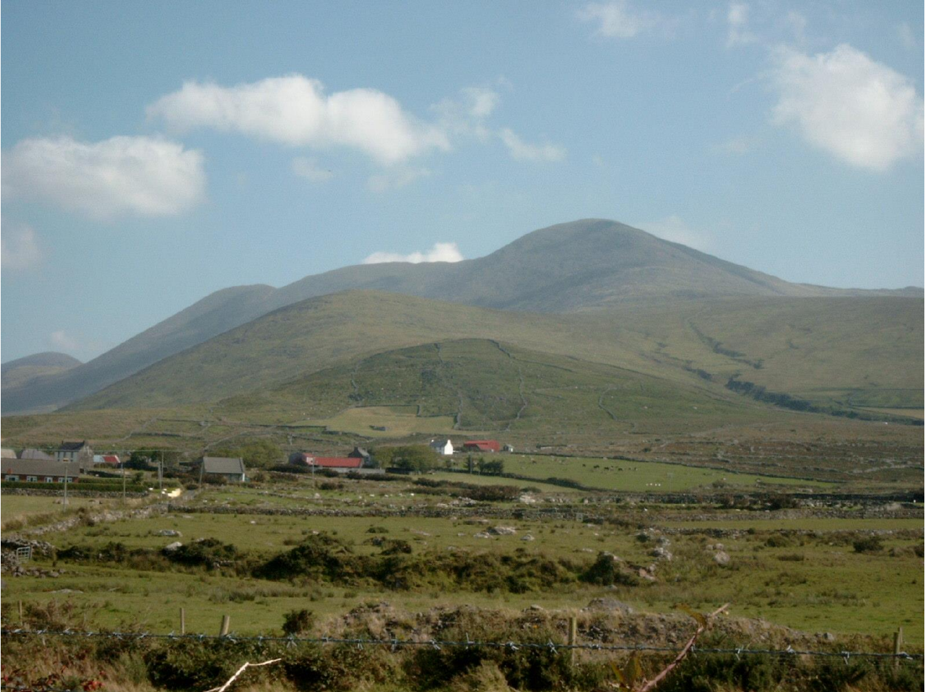
Mount Brandon mit Bally Brack