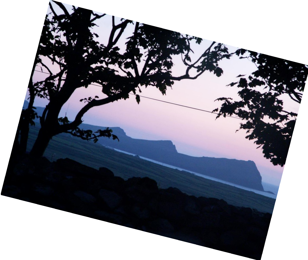
The Three Sisters